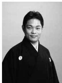
のうがくし いずみりゆうきょうかた 能楽師和泉流狂言方 のむらまたさぶろう 十四世・野村又三郎